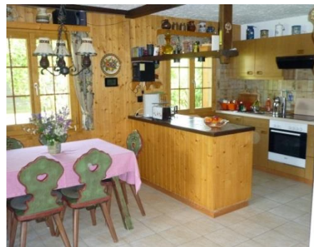
Essbereich mit Küchenzeile

Die Wohnung mit Fußbodenheizung (ca.68qm) bietet: zwei Schlafräume, ein kleines Bad (WC/Dusche), einen Wohnraum (Ausziehcouch, Tisch, TV, zwei Sessel, Stereoanlage, Kamin, Esstisch) mit gut ausgestatteter Küchenzeile, einen kleinen Eingangsbereich (Garderobe), eine Außenkammer (Waschmaschine) und eine Terrasse mit Garten am Birkenbach.