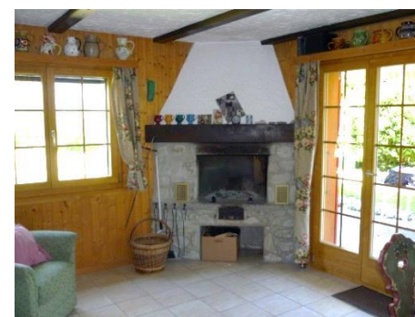
Wohnbereich mit Kamin

Preise: (pro Tag, incl. Strom, Wasser, Müllpauschale)