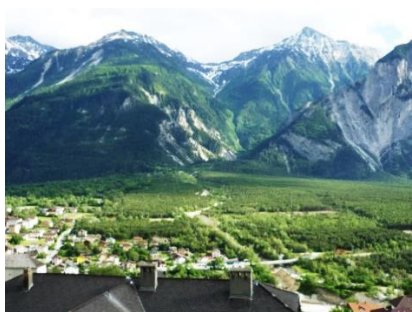
Blick auf Susten/Platschen

In Susten gibt es Einkaufsmöglichkeiten, eine Postfiliale, am Bahnhof die Bank und die Touristeninformation, gute Zug- und Busanbindungen sowie einen Fahrradverleih. Am Campingplatz Bella Tola kann man im Sommer zeitweise Brötchen und Kleinigkeiten einkaufen. Nur 5 Gehminuten vom Chalet entfernt beginnt Mitteleuropas größter Föhrenwald, der Naturpark Pfynges ( www.pfynges.ch ), den man über die Bhutanesische Hängebrücke erreicht. Inmitten einer vogelreichen Natur liegt der Golfplatz Leuk ( www.golfleuk.ch ) und gegenüber Susten von Rebbergen umgeben das historische Leuk-Stadt ( www.schlossleuk.ch ). Zentral im Rhonetal gelegen ergeben sich weitere zahlreiche Ausflugsmöglichkeiten. Zermatt oder der Genfer See sind innerhalb 1 Stunde zu erreichen. Mit der nächsten Stadt Sierre beginnt der französisch-sprachige Teil des Wallis. Dort gibt es den herrlichen Badensee Lac de Géronde mit einem schönen Schwimmbad. In Martigny sind wechselnde Kunstausstellungen zu besichtigen. Im Winter können Skiurlauber z.B. die Skigebiete Torenthorn oder Crans-Montana besuchen. Der Kurort Leukerbad mit seinen Thermalbädern ist in 30 Min. zu erreichen.